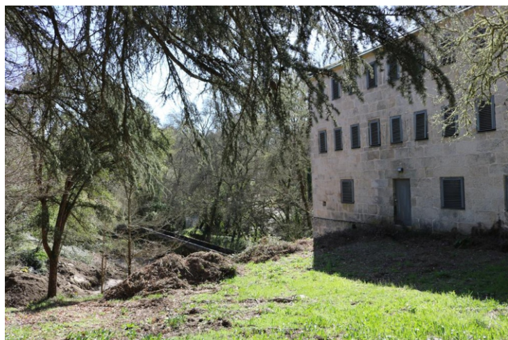
Fábrica de papel