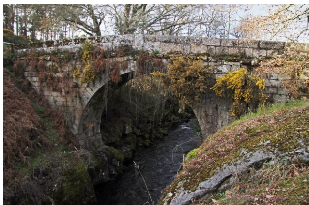
Ponte da Veiga

Comezamos no aparcamento do Parque, e desde alí, remontando o río, pasaremos ao pé do balneario, por debaixo das pontes da estrada e o ferrocarril ata chegar á Ponte da Veiga. Diante da ponte da Veiga hai outra ponte desde a que podemos ver, augas arriba, un atranco que desviaba a auga a un enxeño hidráulico impulsado por unha grande roda vertical que xa se ve moi estragada (podemos velos máis de preto se cruzamos a ponte e baixamos pola escaleira que se atopa xusto en fronte deles da outra beira do río). Neste punto damos a volta. Facémolo polo camiño da ida ata que cheguemos á ponte peonil para continuar a camiñada pola outra beira. Cando chegamos enfronte do punto de inicio levamos percorridos 4 km. Continuando a andaina chegaremos ao atranco da piscifactoría onde o camiño se aparta para pasar ao pé da fábrica de papel e cruzar o río. Atopámonos ao pé da Pena dos Namorados, o parque etnográfico e os muíños. Ao pé do primeiro muíño temos unha ponte de madeira pola que se cruza o río de novo e por un trazado acondicionado con pasarelas e escaleiras, pero de certa dificultade, superamos esta zona onde o río corre encaixado, para continuar logo por terreo chan ata chegar á ponte de Godás do Río aquí, seguindo o carreiro dos pescadores, pasamos por debaixo da ponte e continuamos pola beira da auga ata onde se xunta o rego das Pedriñas que cruzamos pola pontella do camiño que seguiremos xa ata a Ponterriza. Vista a ponte e o cruceiro do lugar volvemos polo mesmo camiño da ida.