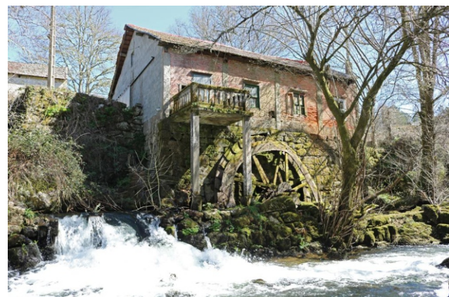
Enxeño hidráulico ao pé da Ponte da Veiga