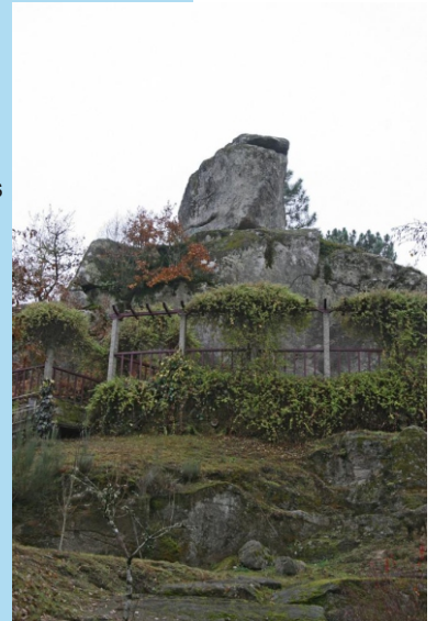
Pena dos namorados